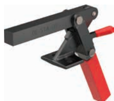
527 Fuß abgewinkelt