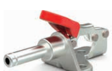
601-M mit Innengewinde