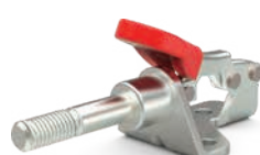
601-O mit Außengewinde, mit Zollgewinde