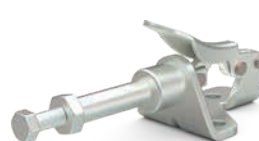
601-SS Edelstahlausführung mit Zollgewinde