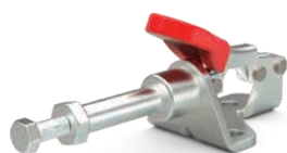
601 mit Zollgewinde