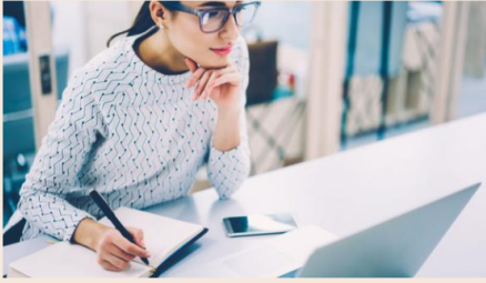
Si existe una respuesta casi concertada a la pregunta de cómo podríamos cambiar el mundo, siempre escucharemos la misma respuesta: a través de la educación.

Si existe una respuesta casi concertada a la pregunta de cómo podríamos cambiar el mundo, siempre escucharemos la misma respuesta: a través de la educación.