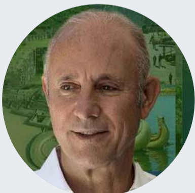
Javier González-Olaechea MDD II Ex - Ministro de Relaciones Exteriores / Internacionalista y Politólogo

Este curso representa una excelente oportunidad para quienes desean convertirse en directores independientes, brindando las herramientas necesarias para desempeñar con éxito ese rol. La red de contactos, formada por profesionales senior, es altamente enriquecedora y ofrece perspectivas valiosas de diversos sectores.