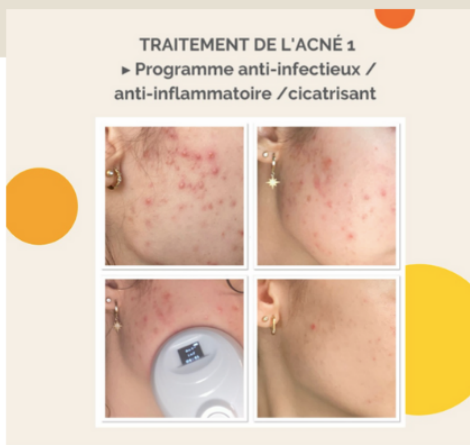
TRAITEMENT DE L'ACNÉ 1 ► Programme anti-infectieux / anti-inflammatoire / cicatrisant