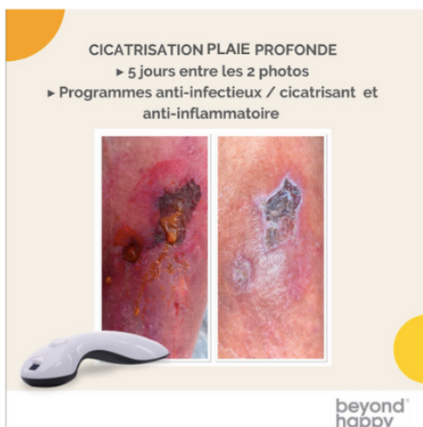
CICATRISATION PLAIE PROFONDE ► 5 jours entre les 2 photos ► Programmes anti-infectieux / cicatrisant et anti-inflammatoire