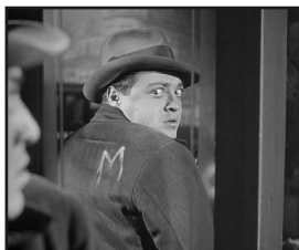
"M", de Fritz Lang (1931)

Le cinéma classique est en réalité profondément révolutionnaire. Ce module dévoile les meilleurs films pendant la montée des grands genres, la codification narrative et l'élégance formelle qui ont marqué des générations de cinéastes.