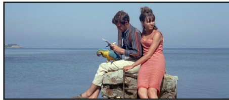
"Pierrot le Fou" de Jean-Luc Godard (1965)

Une révolution esthétique et politique, portée par des voix nouvelles et des formes libres. Nouvelle Vague, Rive Gauche, Free Cinema... Ce module rassemble les mouvements qui ont brisé les codes, redéfini les règles et ouvert la voie au cinéma contemporain.