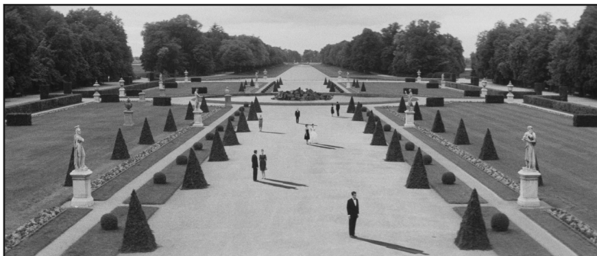
“L’Année Dernière à Marienbad” de Alain Resnais (1961)