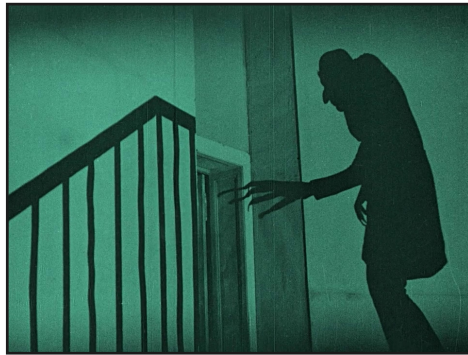
“Nosferatu, eine Symphonie des Grauens”, de Friedrich W. Murnau (1922)

Et surtout : c'est la meilleure manière d'apprendre à créer des images puissantes, expressives et hypnotiques. Ce module met en lumière les pionniers du 7 e art et les chefs-d'œuvre qui ont posé les bases du langage cinématographique.