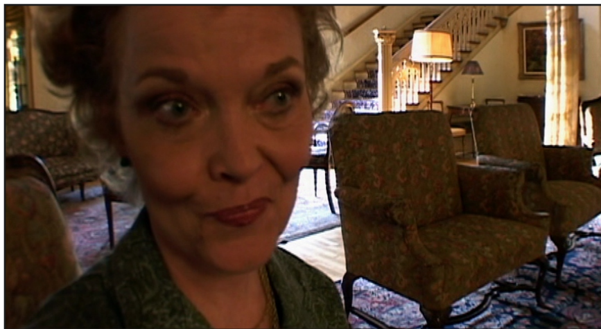
“Inland Empire” de David Lynch (2006)