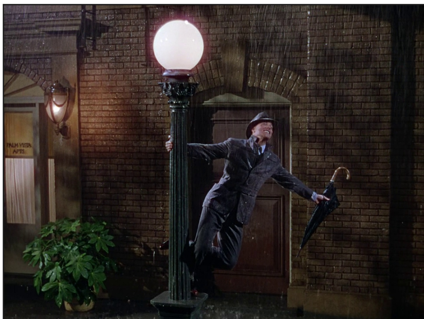
“Singin’ in the Rain” de Stanley Donen et Gene Kelly (1952)