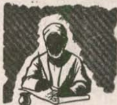
Mga katawhang gitawag ug escriba nagkopya sa kasulatan