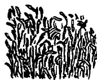
Le champ de blé