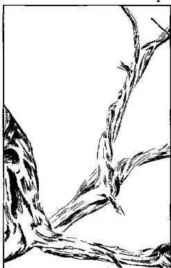
PAS DE FRUIT RETRANCHEZ-LE !

3. Il y a des sarments qui portent du fruit—ils sont émondés. « Tout sarment qui porte du fruit, il l'émonde afin qu'il porte encore plus de fruit » (Jean 15.2). Le jardinier veut que les ressources de la vigne, porteuses de vie, se répandent dans le fruit plutôt que dans les sarments et les feuilles inutiles. Par conséquent, dans le but de produire davantage de fruits et qui plus est, d'une meilleure qualité, l'émondage ou la taille du sarment est une étape nécessaire.