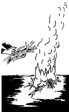
PAS ATTACHE BRULEZ-LE !