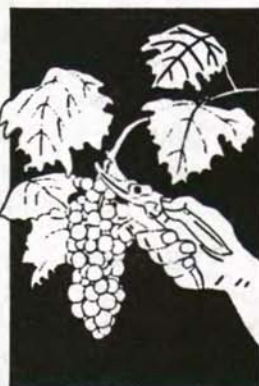
МНОГО ПЛОДА — ОЧИСТИТЬ ЕЕ!