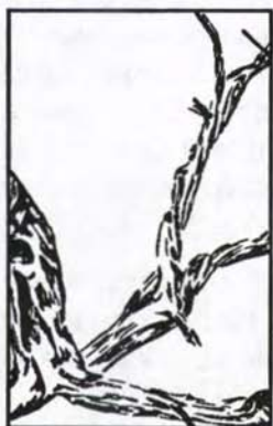
НЕТ ПЛОДА — ОТРЕЗАТЬ ЕЕ!

3. Ветви, приносящие плод - очищаются. "... и всякую, приносящую плод, очищает, чтобы более принесла плода" (Иоанна 15:2). Садовник желает, чтобы жизненные соки напитали плод более, чем саму ветвь или листья. Тем не менее, для принесения лучшего плода, необходимо очищение ветвей.