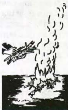
ОТЛОМИЛАСЬ — СЖЕЧЬ ЕЕ!