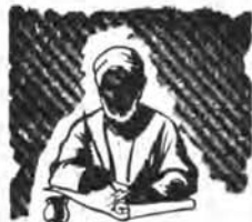
ANO MGA TAGASULAT ANG GUMAWA NG MGA KOPYA NG MGA KASULATAN

Kopyahin ang talaang Ito ng Mga Sulat ni Pablo Mga Taga Roma 1 at 2 Mga Taga Corinto Mga Taga Galacia Mga Taga Efeso Mga Taga Filipos Mga Taga Colosas 1 at 2 Taga Tesalonica 1 at 2 Timoteo Tito, Filemon Hebreo