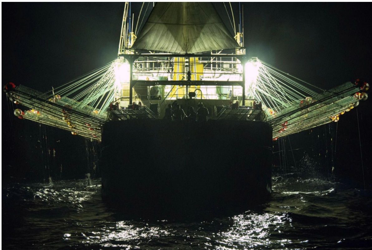
Tàu cá Trung Quốc hoạt động ngoài khơi quần đảo Galapagos.

Đây là lần đầu tiên các nhà khoa học châu Âu trên tàu Ocean Warrior tận mắt chứng kiến đội tàu cá lớn nhất thế giới. Đội tàu 300 chiếc của Trung Quốc giông buồm đi qua nửa vòng Trái Đất, đến tận Nam Mỹ để đánh bắt loài mực Humboldt, theo AP.