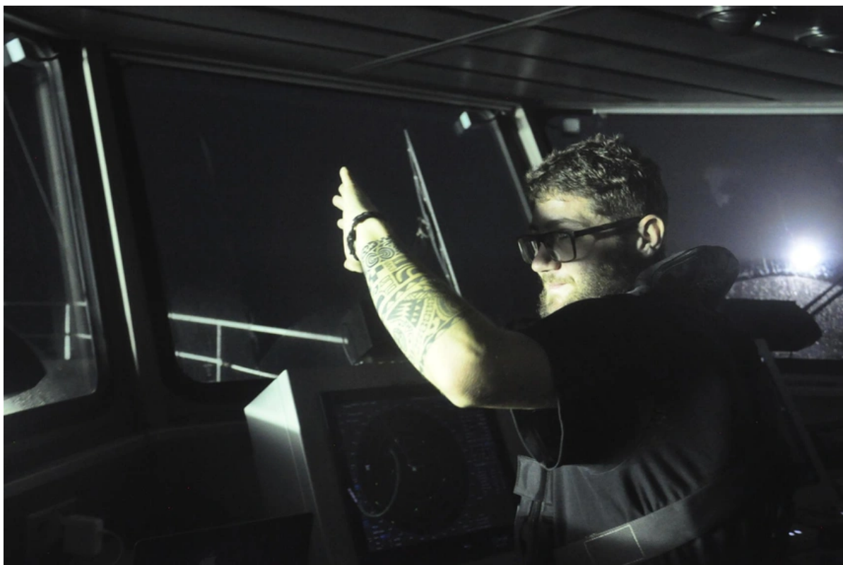
Thủy thủ đoàn trên tàu Ocean Warrior bị chói mắt bởi ánh sáng từ đội tàu cá Trung Quốc.

"Những dấu hiệu này thường đi kèm với hoạt động đánh cá trái phép", theo AP.